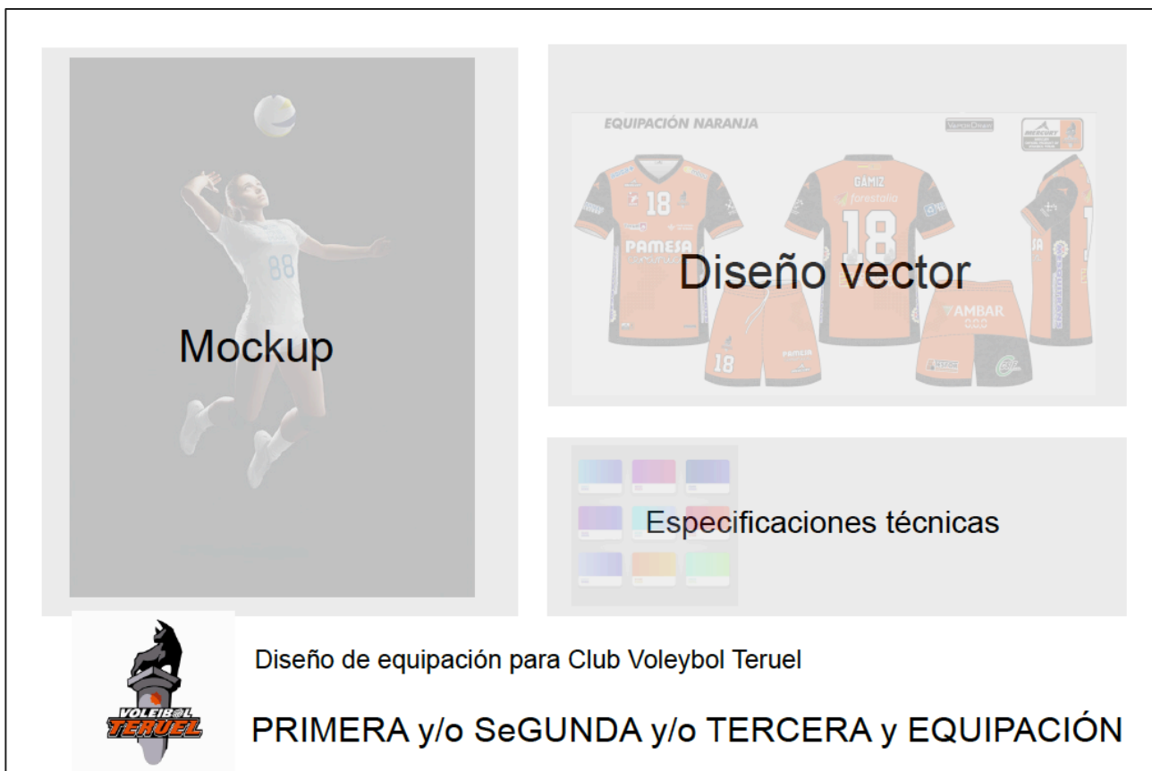
Imagen superior. Disposición del diseño realizado para su presentación en el panel expositor. Formato 60 x 40 cm

Así se presentarán uno o varios paneles (según los diseños de las diversas equipaciones realizados: primera, segunda y/o tercera). Formato A2 (40 x 60 cm horizontal) en el que se incluirá un mockup del diseño, el propio diseño vectorial y las especificaciones técnicas necesarias. Teniendo como guía el diseño mostrado a continuación.